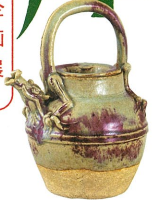
河井寛次郎《茄紫蝸龍茶甌》大正10年(1921)頃