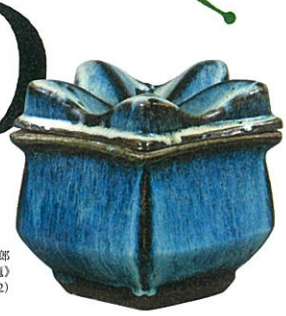
河井寛次郎 《海鼠軸五角食籠》 昭和17年(1942)