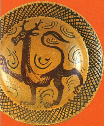
バーナード・リーチ 《ガレナ軸筒描グリフォン図大皿》 昭和27年(1952) ©The Bernard Leach Family, DACS & JASPAR 2021 E4267