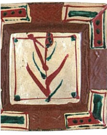
濱田庄司 《柿軸赤絵角皿》 昭和47年(1972)頃 ©濱田壺