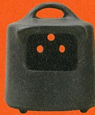
《手あぶり 天津黒陶》 昭和25年(1950)頃 出雲民藝館蔵