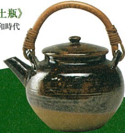
《喜阿弥焼 小土瓶》 江戸時代末期～昭和時代 (19～20世紀) 出雲民藝館蔵