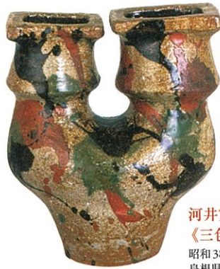
河井寛次郎 《三色扁壺》 昭和38年(1963)頃 島根県立美術館蔵