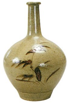
《石見焼 銕絵笹文大徳利》 江戸時代末期～昭和時代 (19～20世紀) 石見安達美術館蔵

本展では、河井寛次郎の初期から晩年までの仕事を、島根県立美術館(松江市)のコレクションからとりあげます。合わせて、民藝運動を全国に推進した作家たちの作品や、島根の民藝についてもご紹介いたします。河井の豊かな造形と、ご当地ならではの手仕事の魅力をお楽しみください。