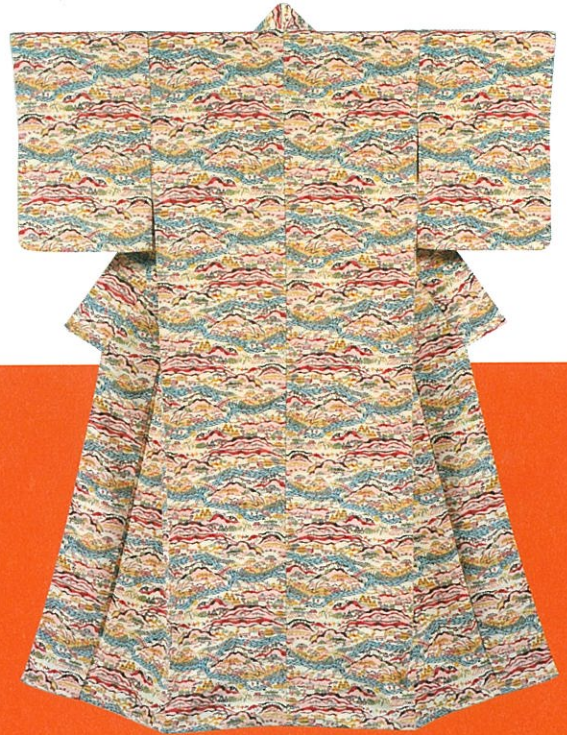
岸沢鈺介《小川紙漉村文着物》 昭和18年(1943) 個人蔵