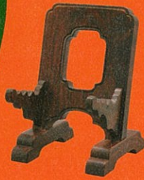
河井益一《皿立て》 昭和時代(20世紀) 個人蔵