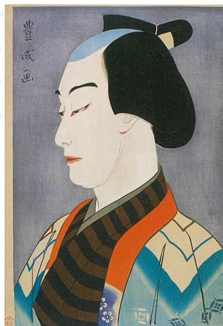
山村耕花《梨園の華 初世中村鴈治郎の西半七》1920年 木版、紙 島根県立美術館蔵(前期展示)