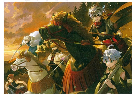
乃希《出陣》2021年 デジタルデータ 益田市蔵