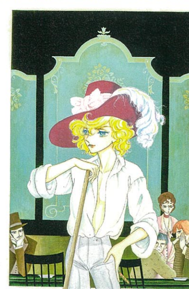
竹宮恵子 《高貴なるもの(『風と木の詩』より)》1976～84年 原画ダッシュ 京都精華大学国際マンガ研究センター蔵 『風と木の詩』「高貴なるもの」