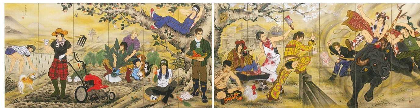
木村了子《男子楽園図屏風-EAST & WEST》2011年 紙本着色 作家蔵