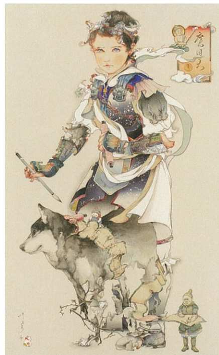
入江明日香《曠目天》2016年 ミクストメディア 丸沼芸術の森蔵