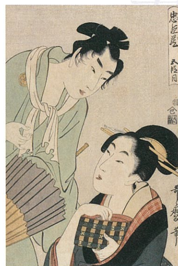
喜多川歌麿《忠臣蔵 五段目》1790年代頃 木版、紙 島根県立美術館蔵(後期展示)