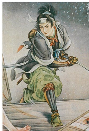
高島華宵《主税の奮戦》昭和初期 印刷、紙 弥生美術館蔵(前期展示)