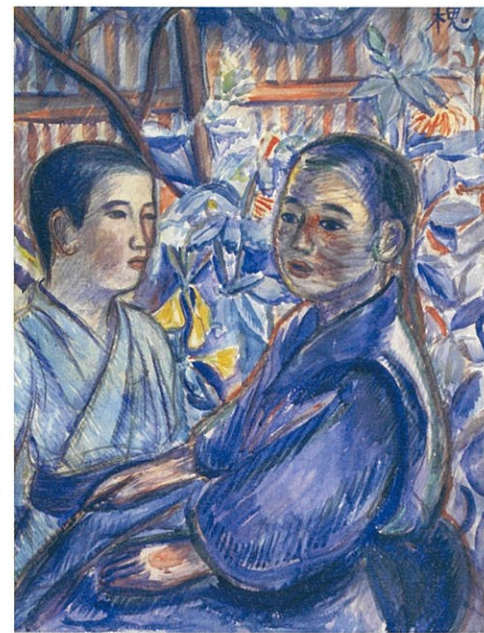
村山槐多《二人の少年(二少年図)》1914年 水彩、紙 個人蔵(世田谷文学館寄託)(前期展示)