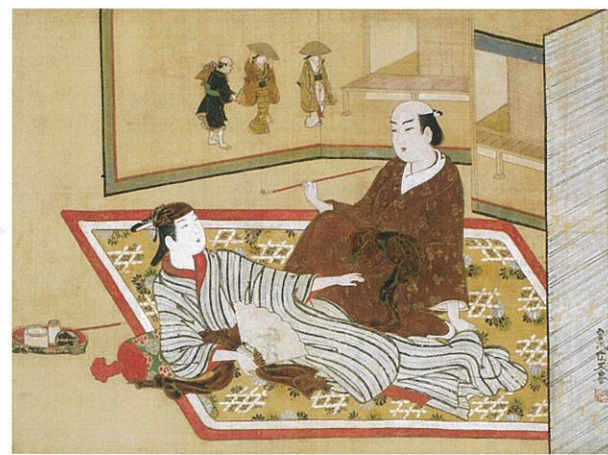
宮川一笑《色子(大名と若衆)》18世紀 絹本着色 たばこと塩の博物館蔵(後期展示)

本展は、日本の視覚文化に表された美少年、美青年のイメージを追い、人々が理想の男性像に何を求めてきたかを探る試みです。美術の分野において、男性を美しいものとして表現すること、見ること、そして語ることにはまだ十分な光が当たっているとは言えません。ライフスタイルが多様化した現代、「美男画」との出会いはどのようなものになるのでしょうか。浮世絵、日本画、雑誌や挿絵、現代作家の作品、マンガなど、時代やジャンルを問わず多彩な男性像を一堂に集め、その制作や受容の背景を見ていきます。