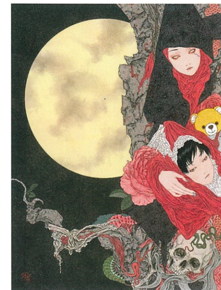
山本タカト《Nosferatu・異》2018年 アクリル、紙 個人蔵