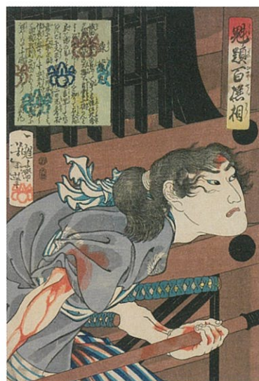
月岡芳年《魁題百撰相 森蘭丸》1868年 木版、紙 町田市立国際版画美術館蔵(前期展示)