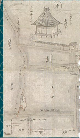
萬福寺境内図 萬福寺所蔵