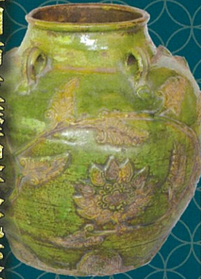
華南三彩貼花文五耳壺 萬福寺所蔵