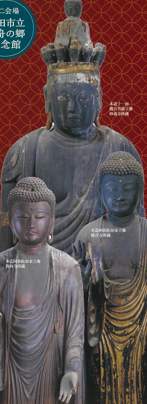
木造十一面 観音菩薩立像 妙義寺所蔵