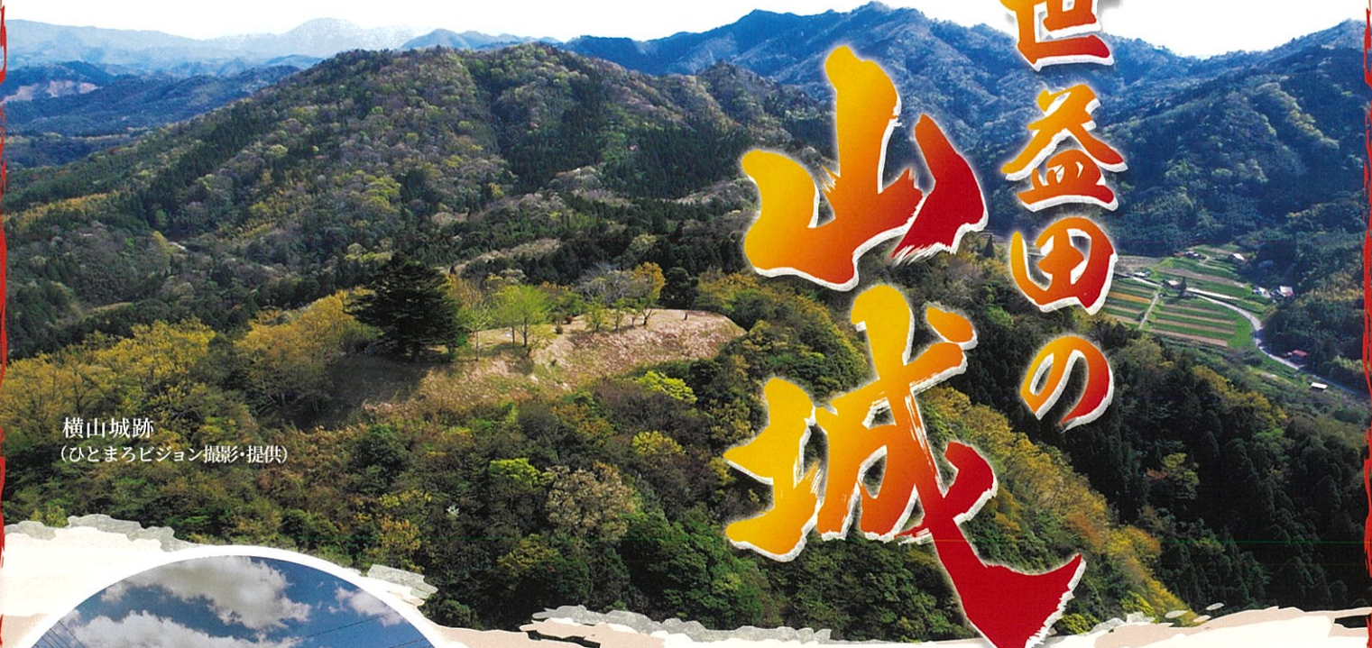
横山城跡