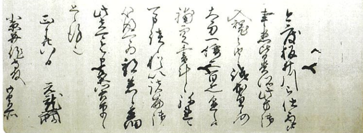
毛利元就書状 (広島大学所蔵「小原文書」)