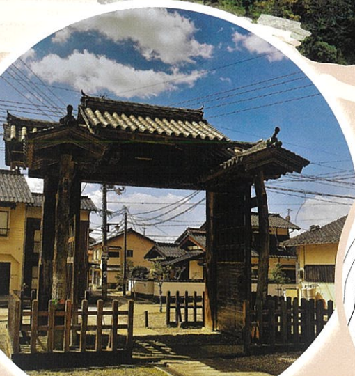
医光寺総門 (鳥根県指定文化財 伝元七尾城大手門)