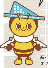
萩・石見空港 オリジナルキャラクター トビーくん