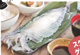
お食事処(イメージ)