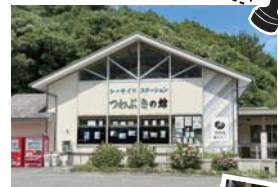
ホルンフェルス休憩所「つわぶきの館」