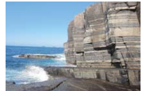
須佐ホルンフェルス