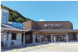
いかマルシェ(JR須佐駅)