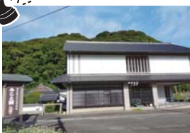
須佐歴史民俗資料館「みこと館」